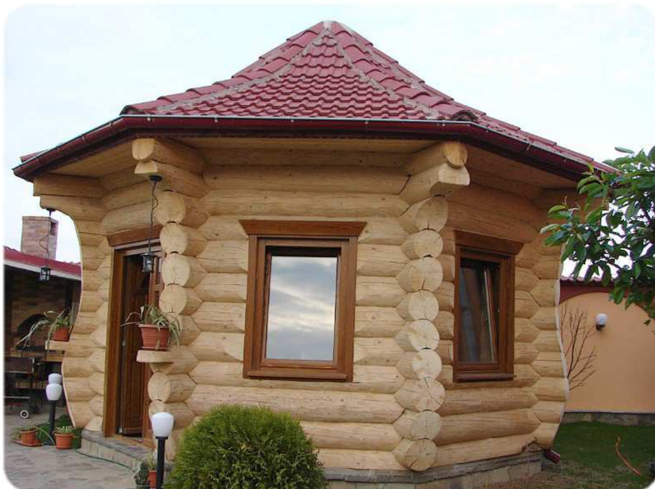
PHOTO OCTOGON HOUSE/20 M 2