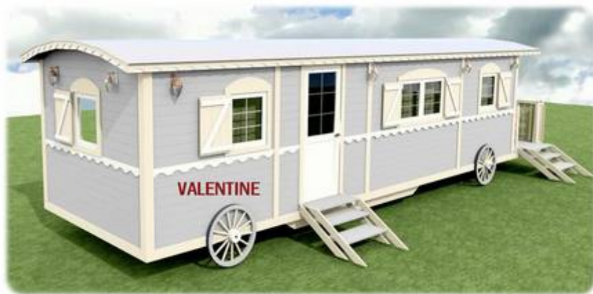
RINA BELLA SWAN