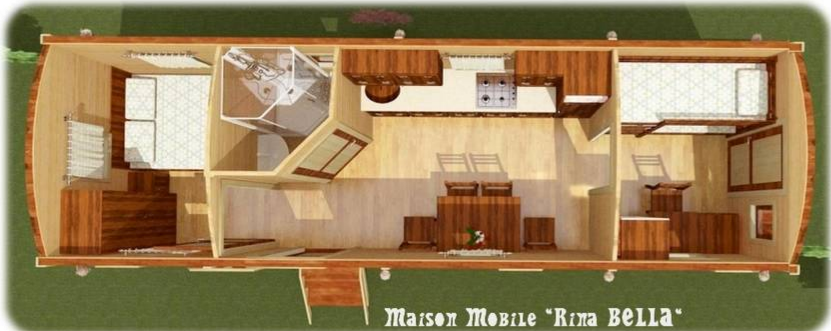
Maison Mobile "Rina Bella"