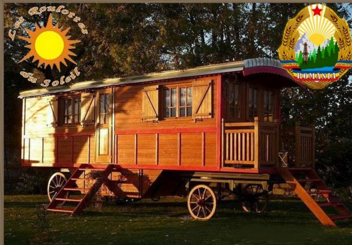
Les Roulottes du Soleil 2018