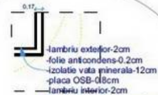
Detaliu perete D-01